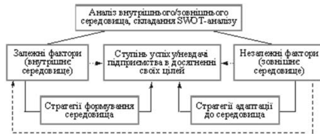
Рис 2.1. Принципова схема врахування залежних і незалежних факторів

За результатами аналізу вирішено використати сильні сторони: внутрішні чинники - вдале розташування території планування відносно основних транспортних магістралей, можливість розвитку інженерної інфраструктури, сфери обслуговування та рекреації.